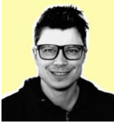
Par Pierre Ecuillon Rédacteur web SEO Formateur marketing et webmarketing